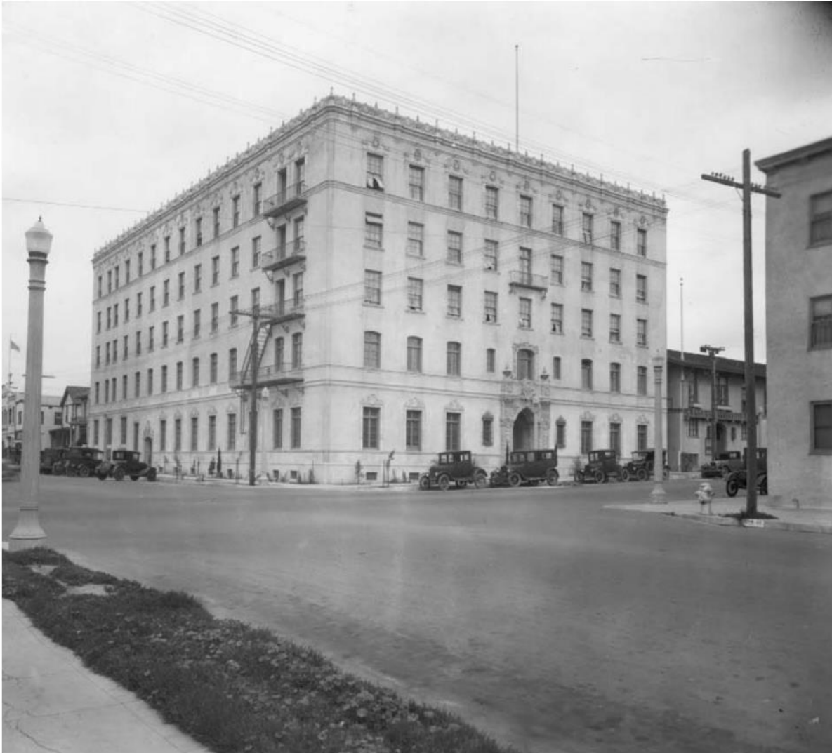
YWCA, Decker and Stevenson (1926), 1927. SDHS 11777