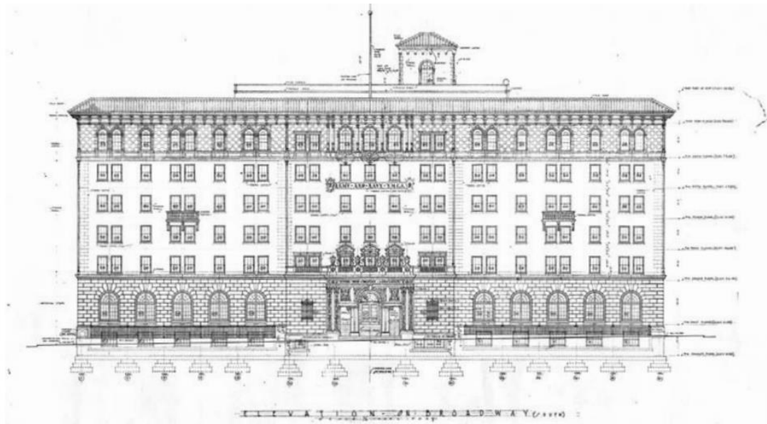
Figure 15: Y.M.C.A., front elevation, Lincoln Rogers and Frank W. Stevenson, 1924. SDHS AD 1068-A31